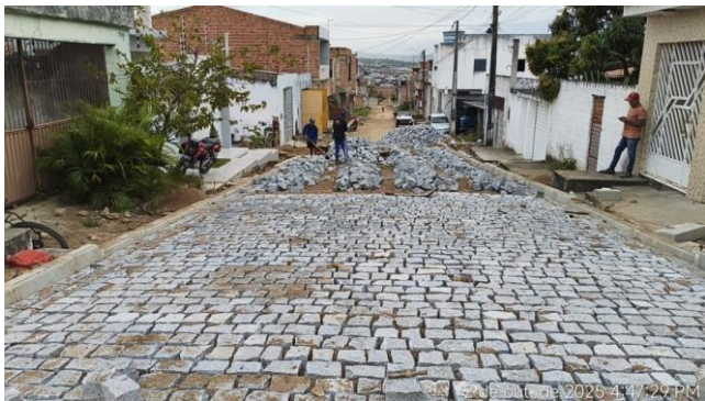
FOTO 04 - RUA ADRIANO IRINEU DOS SANTOS, BAIRRO SANTO ANTÔNIO.

EXECUÇÃO DE PAVIMENTO EM PARALELEPÍPEDOS, REJUNTAMENTO COM ARGAMASSA TRAÇO 1:3 (CIMENTO E AREIA). AF_05/2020