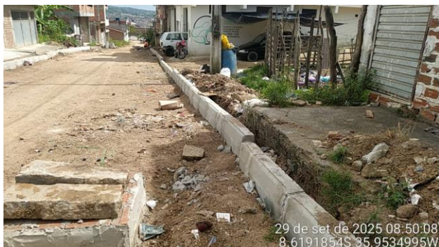
FOTO 03- RUA ADRIANO IRINEU DOS SANTOS, BAIRRO SANTO ANTÔNIO.

ASSENTAMENTO DE GUIA (MEIO-FIO) EM TRECHO RETO, CONFECCIONADA EM CONCRETO PRÉ-FABRICADO, DIMENSÕES 100X15X13X30 CM (COMPRIMENTO X BASE INFERIOR X BASE SUPERIOR X ALTURA). AF_01/2024