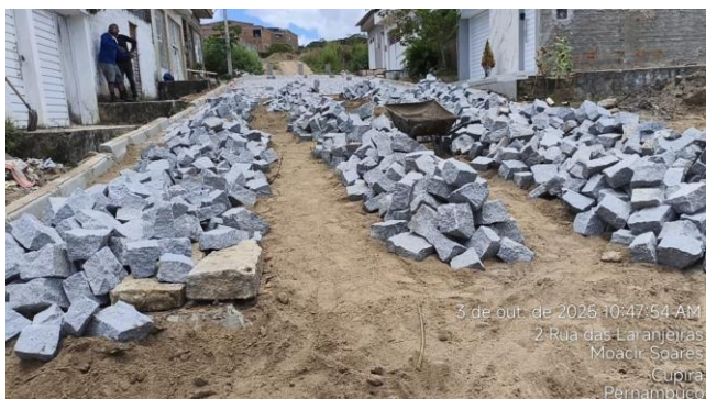
FOTO 7 - RUA ADRIANO IRINEU DOS SANTOS, BAIRRO SANTO ANTÔNIO.

EXECUÇÃO DE PAVIMENTO EM PARALELEPÍPEDOS, REJUNTAMENTO COM ARGAMASSA TRAÇO 1:3 (CIMENTO E AREIA). AF_05/2020