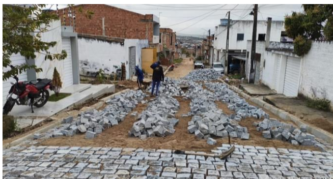
FOTO 05 - RUA ADRIANO IRINEU DOS SANTOS, BAIRRO SANTO ANTÔNIO.

EXECUÇÃO DE PAVIMENTO EM PARALELEPÍPEDOS, REJUNTAMENTO COM ARGAMASSA TRAÇO 1:3 (CIMENTO E AREIA). AF_05/2020