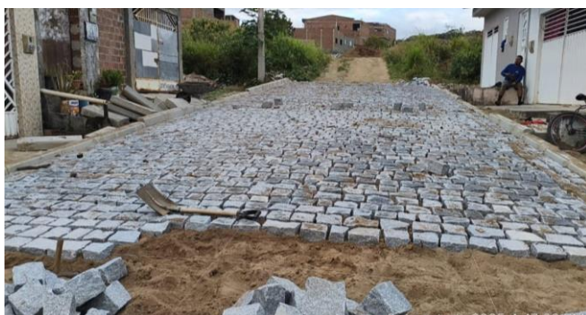
FOTO 06 - RUA ADRIANO IRINEU DOS SANTOS, BAIRRO SANTO ANTÔNIO.

EXECUÇÃO DE PAVIMENTO EM PARALELEPÍPEDOS, REJUNTAMENTO COM ARGAMASSA TRAÇO 1:3 (CIMENTO E AREIA). AF_05/2020