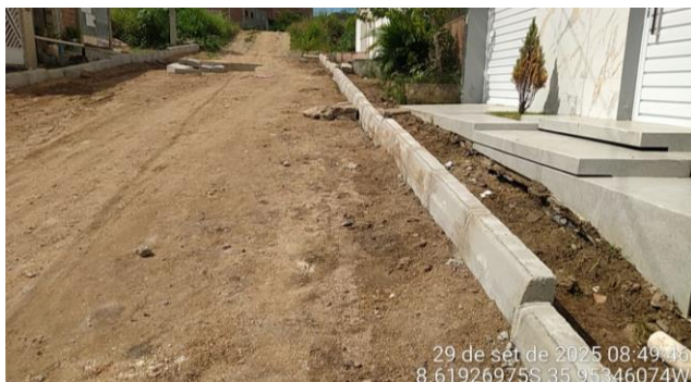
FOTO 02 - RUA ADRIANO IRINEU DOS SANTOS, BAIRRO SANTO ANTÔNIO.

ASSENTAMENTO DE GUIA (MEIO-FIO) EM TRECHO RETO, CONFECCIONADA EM CONCRETO PRÉ-FABRICADO, DIMENSÕES 100X15X13X30 CM (COMPRIMENTO X BASE INFERIOR X BASE SUPERIOR X ALTURA). AF_01/2024